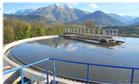
La STEP de La Mure – SIA de la Jonche

Des aides spécifiques : la création ou la réhabilitation de station ou de réseaux hors PAOT, la déconnexion des eaux pluviales des réseaux séparatifs pour petits projets