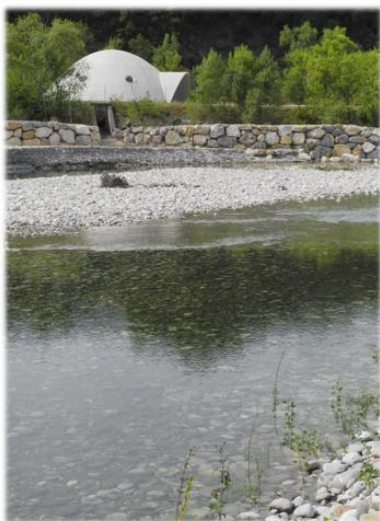
Le Drac et le puits PR4 - GAM