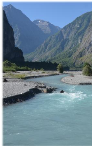
Le Vénéon au Bourg d'Oisans

Des aides spécifiques sur la valorisation patrimoniale, le cadre de vie (sentiers, aménagements paysagers...) liés aux projets aidés.